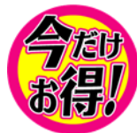
ピザ 又は ビーフ100%石窯焼きハンバーガー