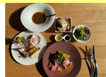
4才～小学生お食事（当日選択）