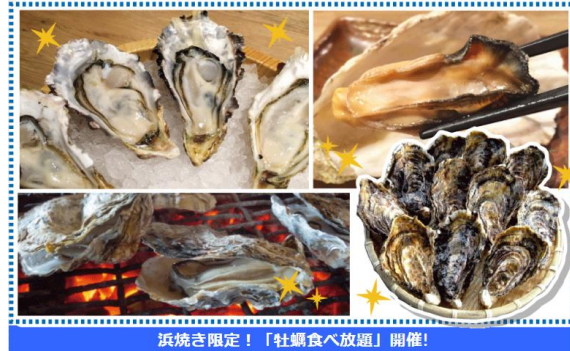
浜焼き限定！「牡蠣食べ放題」開催！