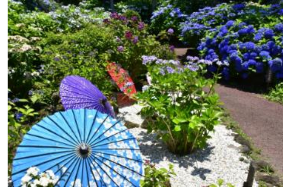
あじさい苑は、5月下旬～7月上旬オープン（予定）