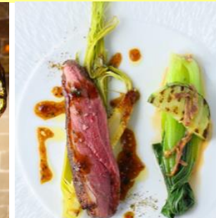
ミクニ伊豆高原店は6/1～6/12まで、夏季連休となります。