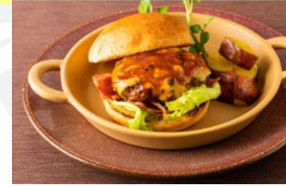
4才～小学生お食事（当日選択）