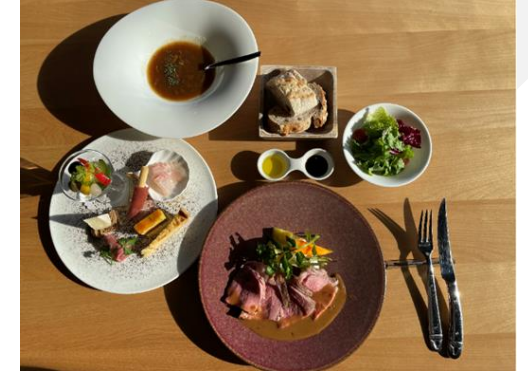
ランチスタート 12:00 12:30 13:00 13:30（事前予約制）